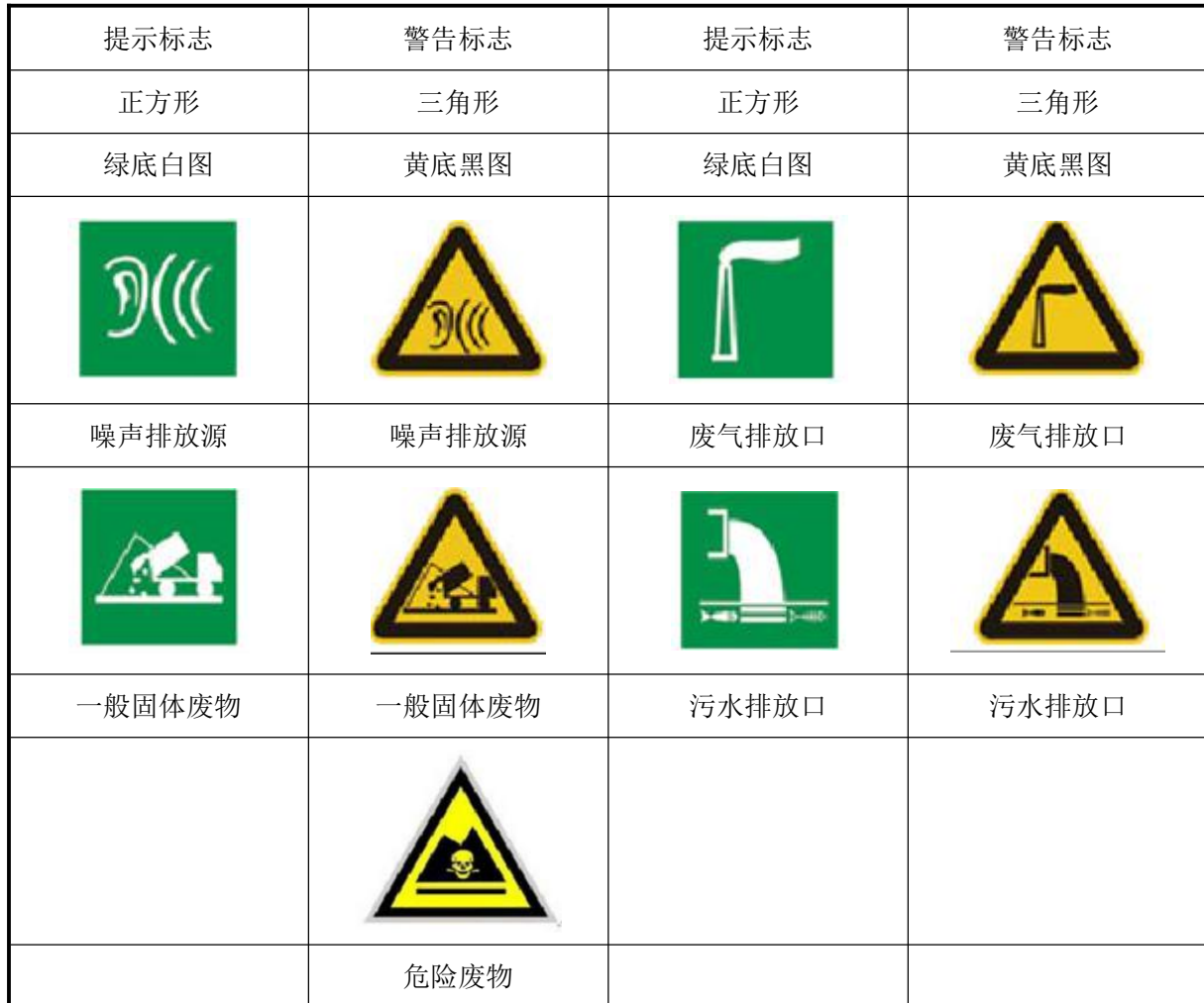
表 7-23 排放口环境保护标志

(2) 排放口的环境保护标志牌应设置在靠近采样点的醒目处, 标志牌设置高度为其上缘距地面约 2m。